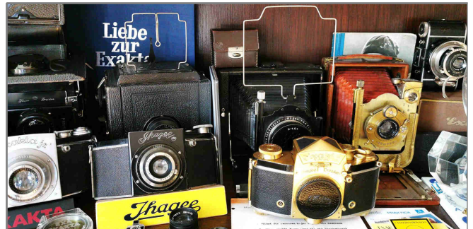
Ein kleiner Teil der Arnhardt'schen Kamerasammlung